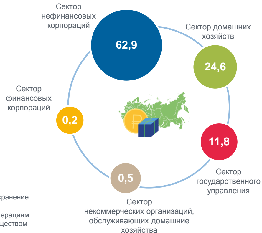
Структура ВРП по институциональным секторам экономики, %