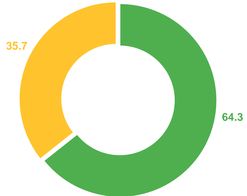
Институциональная структура оборота оптовой торговли (%)

■ Крупные и средние организации ■ Субъекты малого предпринимательства