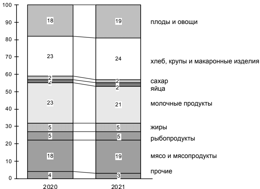
Структура стоимости условного (минимального) набора продуктов питания по Ростовской области, рассчитанного по среднероссийским нормам потребления, в августе 2021 и 2020 годов (в процентах, в расчете на одного человека в месяц)

По Ростовской области стоимость условного (минимального) набора продуктов питания в августе 2021 года составила 4499,05 рубля в расчете на 1 человека и по сравнению с предыдущим месяцем снизилась на 2,3 процента, с начала года увеличилась на 7,2 процента (в августе 2020 г. снизилась на 2,6%, с начала года увеличилась на 5,9%).