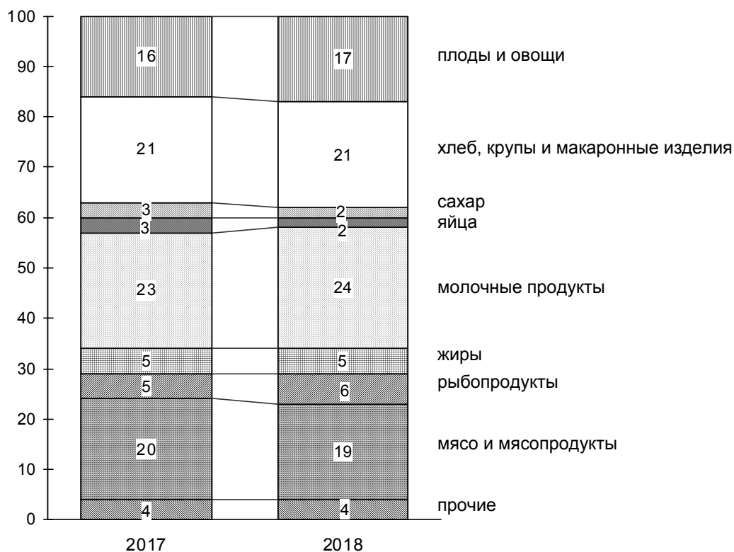
Структура стоимости условного (минимального) набора продуктов питания по Ростовской области, рассчитанного по среднероссийским нормам потребления, в январе 2017 и 2018 годов (в процентах, в расчете на одного человека в месяц)

По Ростовской области стоимость условного (минимального) набора продуктов питания в январе 2018 года составила 3452,86 рубля в расчете на 1 человека и по сравнению с предыдущим месяцем увеличилась на 1,8 процента (в январе 2017 г. – на 1,1%).