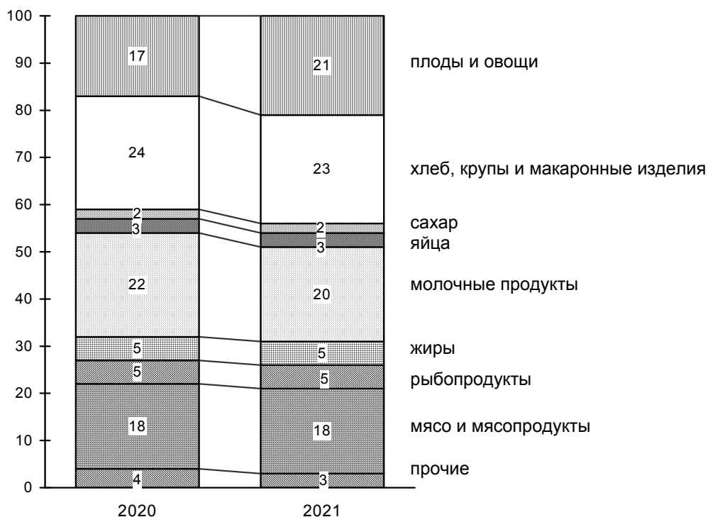
Структура стоимости условного (минимального) набора продуктов питания по Ростовской области, рассчитанного по среднероссийским нормам потребления, в декабре 2021 и 2020 годов (в процентах, в расчете на одного человека в месяц)

По Ростовской области стоимость условного (минимального) набора продуктов питания в декабре 2021 года составила 4963,80 рубля в расчете на 1 человека и по сравнению с предыдущим месяцем увеличилась на 1,5 процента, с начала года – на 18,3 процента (в декабре 2020 г. увеличилась на 3,3%, с начала года – на 11,3%).